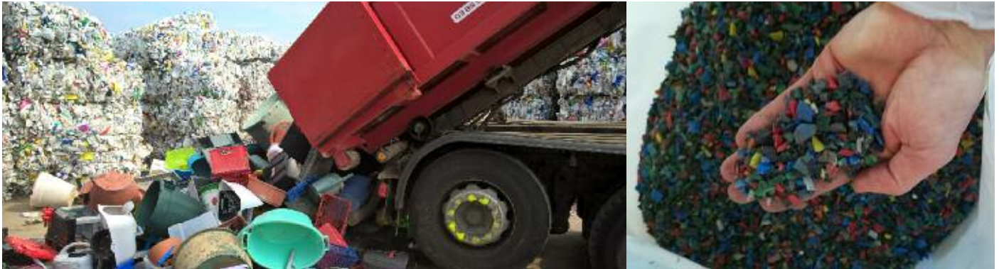
Incorporation des plastiques durs : à gauche, la benne de collecte ; à droite, la matière broyée