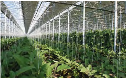
Figure 4 : Serres équipées de capteurs photovoltaïques.

Le choix de la provenance des modules aura donc un impact important sur les performances environnementales de l'installation. En fonction de l'ensoleillement, ces émissions à la fabrication sont compensées en moins de 2 à 3 ans de production.