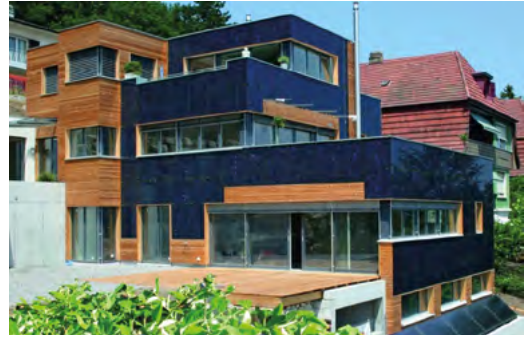
Figure 5 : Exemple d'intégration architecturale sur petit bâtiment tertiaire.

Enfin, hormis l'intérêt individuel du producteur, l'autoconsommation peut présenter un avantage pour le réseau de distribution lui-même : c'est le cas lorsque l'opération d'autoconsommation évite ou réduit des travaux de renforcement des infrastructures du RPD. Par exemple, l'asservissement à la production électrique solaire d'équipements de production de froid éviteront une augmentation de la puissance souscrite, et parfois, des travaux sur l'alimentation du site.