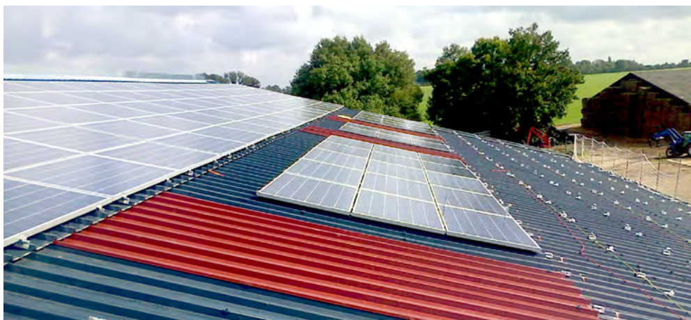
Figure 1 : Installation en autoconsommation dans une ferme d'élevage

En fin de chaque chapitre, un paragraphe dédié apporte précisions et éclairages sur les éventuelles variations ou spécificités importantes existant en Corse et dans les départements d'outre-mer, constituant les zones électriques non interconnectées (ZNI).