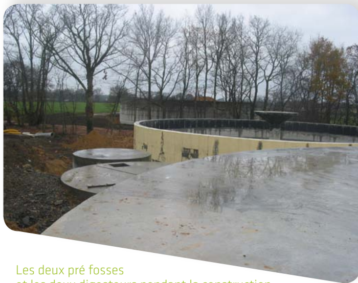
Les deux pré fosses et les deux digesteurs pendant la construction

Les effluents de l'exploitation constituent la ration de base de l'installation apportant la stabilité biologique du mélange. Les déchets agroalimentaires viennent compléter la ration avec un potentiel énergétique plus important afin d'augmenter la production de biogaz.