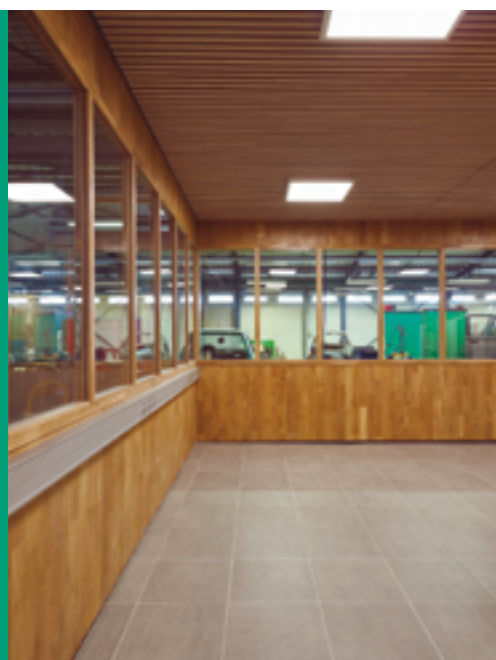
© Le Gallée Architecture / Ducerf Groupe

Valorisation du CLT chêne en rénovation intérieure, atelier de mécanique automobile du lycée Camille-du-Gast à Chalon-sur-Saône.