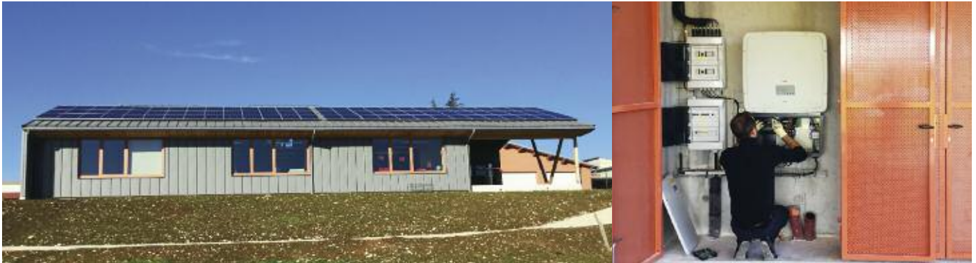
La centrale photovoltaïque de l'école de Chay a été mise en service le 16 octobre 2019